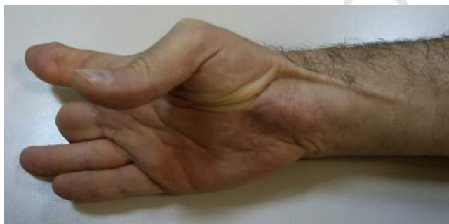
Figura 4 La imagen muestra el trayecto del tendón del palmaris longus , que permite una adecuada anteposición y pinza pollicí-digital. La cobertura de la cara palmar de la muñeca es excelente gracias al colgajo transpuesto.