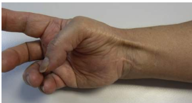
Figura 6 La imagen muestra la excelente función abductora de la transposición tendinosa, cuyo trayecto se nota subcutáneo.

de entre 3 y 6 veces el normal del nervio en el que asientan. Desde un punto de vista anatomopatológico, el LFH es un aglomerado desorganizado de masas adiposas lobuladas y fusiformes, que aumentan el diámetro y la longitud del nervio afectado y se entrecruzan entre los tabiques fibrosos y los fascículos nerviosos. La parte proximal y distal del nervio son generalmente normales, pero el segmento afectado puede alcanzar hasta 10 cm de longitud. Una característica típica del LFH es que no se adhiere a los tejidos circundantes. Microscópicamente, el epineuro está ensanchado e infiltrado por el tejido fibroadiposo, que separa y comprime los fascículos nerviosos 5 . Esta infiltración origina la atrofia de los elementos neurales, a menudo seguida por una importante fibrosis perineural. El depósito de colágeno y la pérdida de los axones son indicadores de estos cambios crónicos. En algunos casos hay tabiques perineurales y formación de microfascículos 4 .