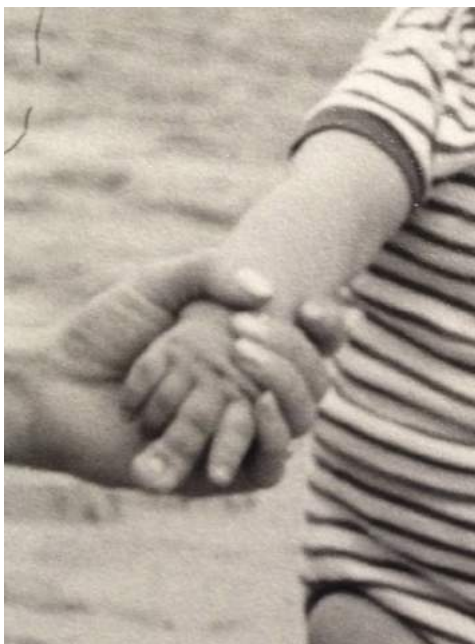
Figura 1 Caso 1: imagen de la mano del paciente a los 8 meses de edad, en la que se aprecia claramente la macrodactilia del índice y sobre todo del dedo medio.

dedos afectados. La resonancia magnética denota una imagen típica del LFH del nervio mediano como una masa muy voluminosa en cuyo interior se constata una estructura cableada con aumento de intensidad de señal de resonancia, patognomónica de este proceso (fig. 2).